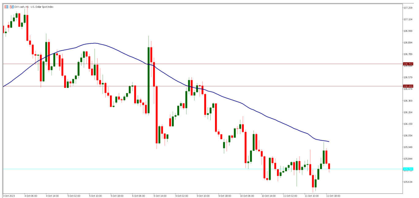
DX Y H1

随着美元指数 (DXY) 不断回落, 澳美 (AUDUSD) 在一改数周前颓势, 开始慢慢展开攻势。从上周低位 0.629 一路攀升, 在昨日来到 0.64452, 随后又小幅回调,