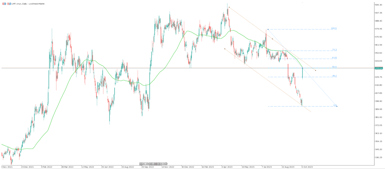
LMT.xnys 日 K 线图